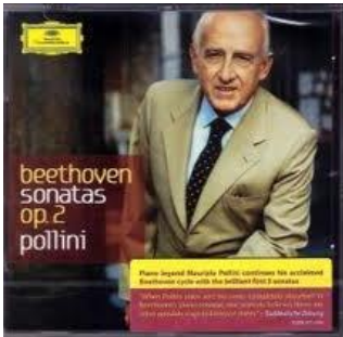
Aufnahme 4: Maurizio Pollini, Klavier Deutsche Grammophon DG 477 6594 (2007)