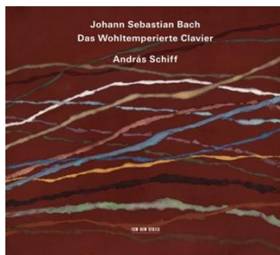
Aufnahme 6: András Schiff, Klavier ECM 476 4827 (2012)