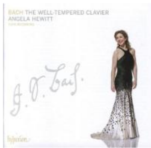
Aufnahme 5: Angela Hewitt, Klavier Hyperion CDA67741 (2009)