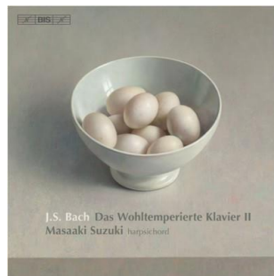
Masaaki Suzuki, Cembalo BIS 1513/14 (2008)