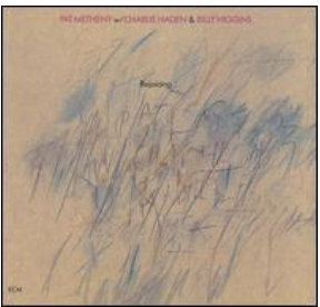
Pat Metheny: "Rejoicing" (1983) ECM, 817795