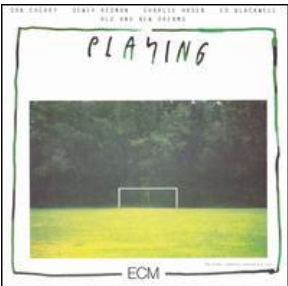
Old and New Dreams: "Playing" (1980) ECM, 829123