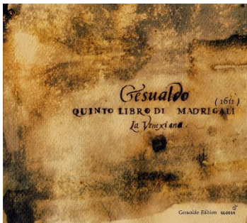
Aufnahme 1: La Venexiana Glossa GCD 920935 (2005)

Er war eine schillernde Persönlichkeit, der italienische Komponist Carlo Gesualdo, Fürst von Venosa. Sein Leben gab über Jahrhunderte Anlass zu wilden Spekulationen, nicht zuletzt, weil er seine erste Ehefrau und ihren Liebhaber in flagranti ertappt und ermordet hatte. Gesualdo hat aber vor allem für die damalige Zeit unglaublich moderne Musik komponiert. Bei seinem Tod 1713 hinterliess er der Nachwelt sowohl kirchliche als auch geistliche Musik, u.a. sechs Sammlungen von Madrigalen. In dieser Diskothek stehen sich verschiedene Aufnahmen seines fünften Madrigalbuches ("Quinto libro dei madrigali") gegenüber, fünfstimmige Madrigale voller Dissonanzen, die auch für heutige Ensembles ausserordentlich schwer zu singen sind.