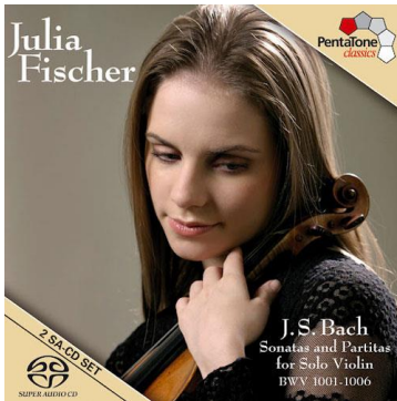
Aufnahme 4: Julia Fischer PentaTone 5186 072 (2004)