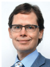
Hansjörg Ryser Mediensprecher Helvetia Versicherungen www.helvetia.ch