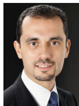
Alfonso Papa CEO Switzerland NN Investment Partners www.nnip.ch