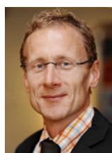
Martin Oberhausser Marketing & Kommunikation Baloise Investment Services www.baloise.ch