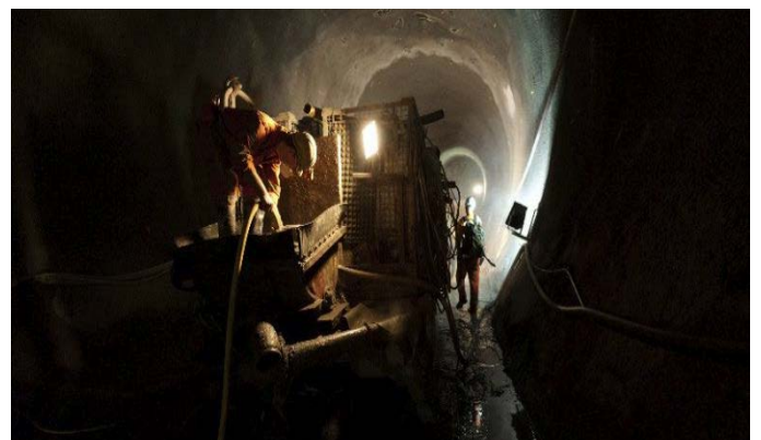
Handarbeit gibt es auch heute noch.