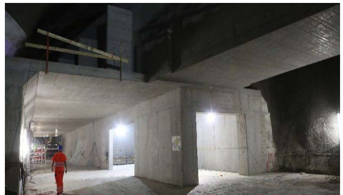
Mehr als nur ein Tunnel: Eine Welt unter Tage.