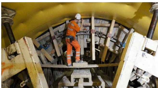
An der Front.