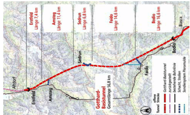
Verlauf des Gotthard-Basistunnels.