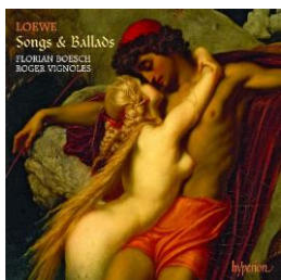
Aufnahme A3: Florian Boesch, Roger Vignoles CD: Loewe: Songs & Ballads Hyperion 2011