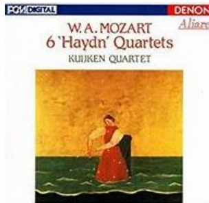
Aufnahme 4: Kuijken Quartet Denon CO-75850-52 (1994)