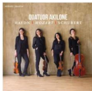
Aufnahme 2: Quatuor Akilone Mirare MIR 388 (2018)