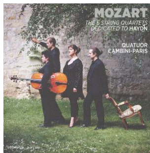
Aufnahme 5: Quatuor Cambini-Paris Ambrosie AM 213 (2014)