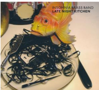
Insomnia Brass Band: Late Night Kitchen Label: Tiger Moon Records