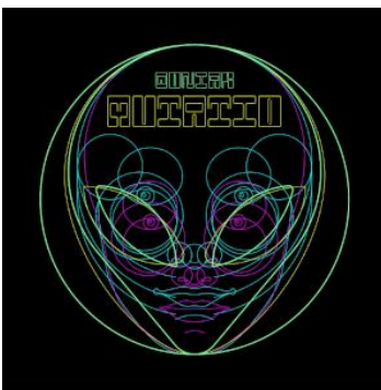
Qoniak: Mutatio Label: Hummus Records