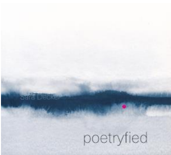
Sara Decker: Poetryfied Label: Acoustic Motion Concepts