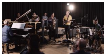
El Dopa: Public Recordings @ SRF, 12.04.22